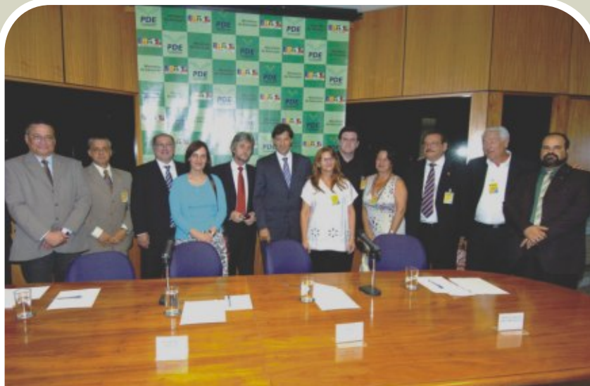
Ministro Fernando Haddad empossa Comissão de Implantação da UFFS