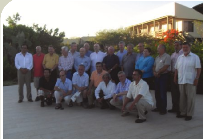
Rectores, expertos y dirigentes latinoamericanos en el Encuentro del CONESUP

En el Encuentro, dirigentes universitarios y expertos de América Latina y el Caribe han producido la Declaración de Galápagos, destacando la importancia de traducir los principios de la Conferencia de Cartagena (CRES 2008) en acciones concretas, la necesidad de impulsar y fortalecer el trabajo universitario en redes y los avances del Espacio Latinoamericano y del Caribe de Educación Superior (ENLACES), acordado en Cartagena. ►