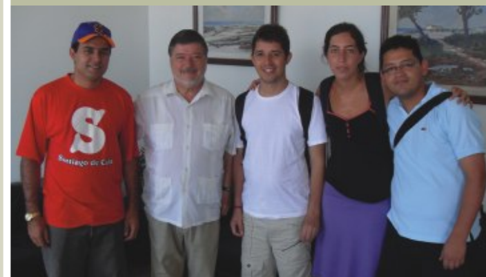
O presidente da CI-UNILA com membros da OCLAE