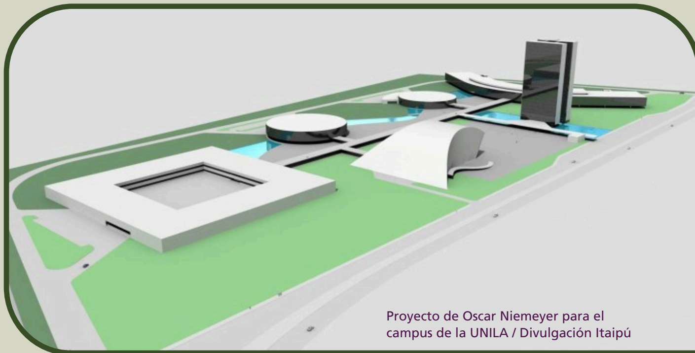
Proyecto de Oscar Niemeyer para el campus de la UNILA