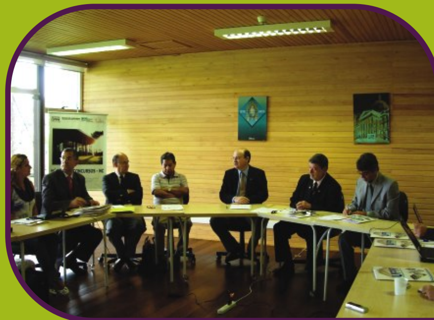
CI-UNILA inaugura escritório técnico na UFPR

O representante da SESu também comentou as reuniões mensais que passaram a ser realizadas entre os presidentes das comissões de implantação das novas universidades para a troca de experiências e que, na sua opinião, o estabelecimento de um escritório técnico, como o da UFPR-UNILA, deve ser levado como exemplo às outras comissões. Ramalho finalizou falando sobre a formação de um comitê do MEC cuja missão será assessorar cada grupo de criação das novas universidades e acompanhar a tramitação de seus projetos no Congresso Nacional. Ele disse, ainda, que a SESu tem certeza do sucesso da UNILA, pois ela é conduzida por uma comissão de entusiastas.