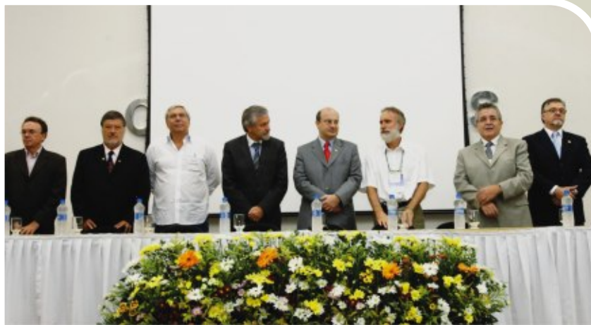
Mesa da cerimônia de doação do terreno de Itaipu para o futuro campus da UNILA