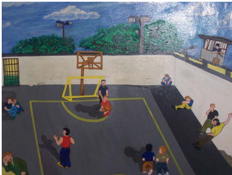
En el patio... Pintura de un interno de Villahermosa

El tratamiento se enfoca a las actividades que rediman pena, tales como las actividades laborales, educativas, de enseñanza, terapéuticas (individual y/o grupal), recreativas, deportivas, culturales y espirituales previa autorización de la Junta de Evaluación de Trabajo, Estudio y Enseñanza fundamentada en las Resoluciones 2376 de junio 17 de 1997 y 3889 de septiembre 11 de 1997.