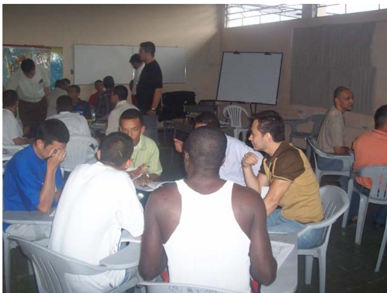
En el aula.