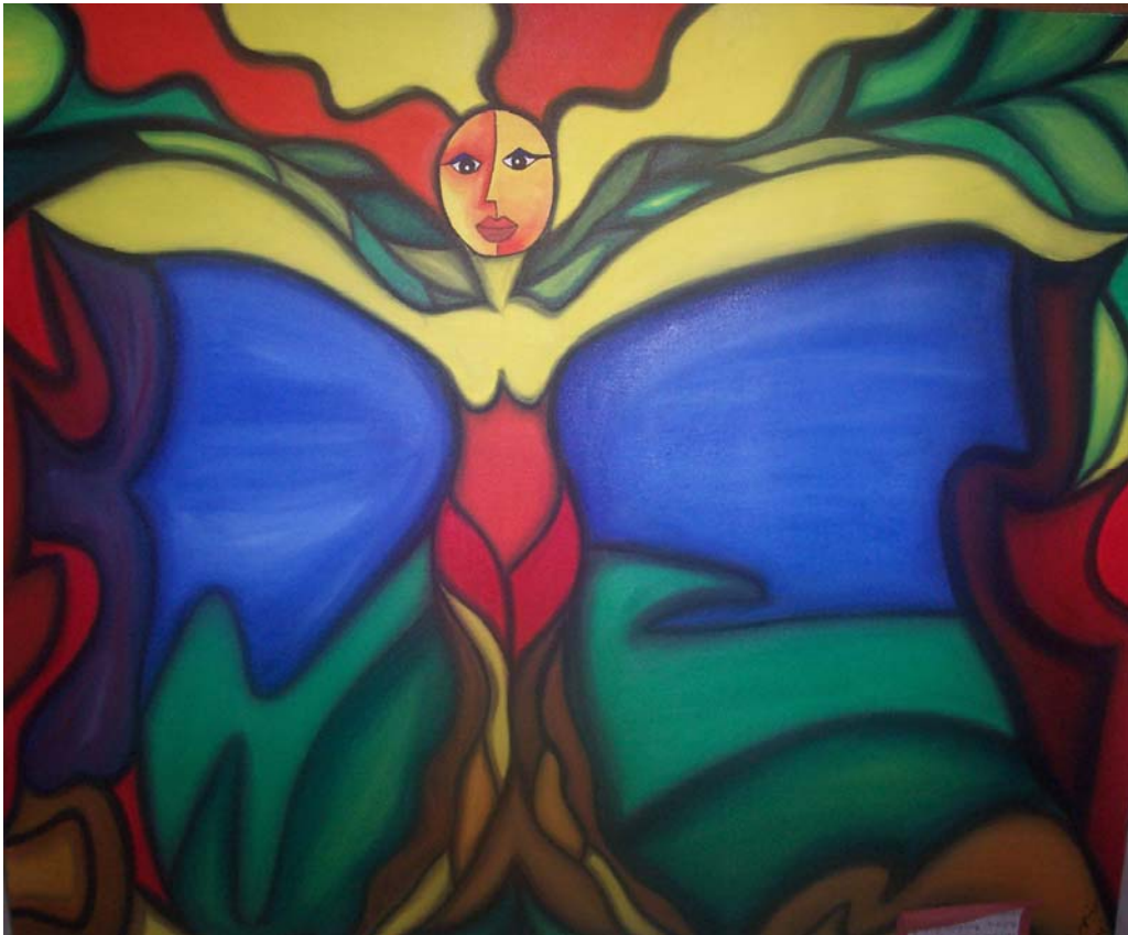
Pintura de un interno de EPC Cali.