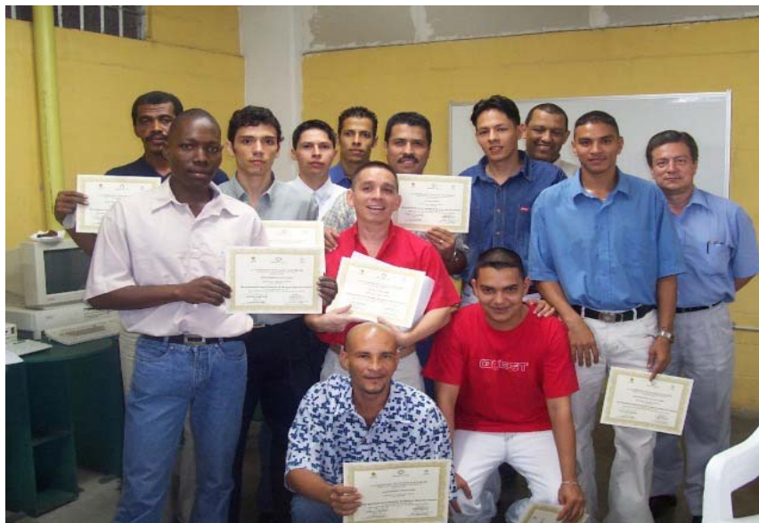
Día de graduación.

Pero en porcentaje relativo, los Establecimientos Penitenciarios y Carcelarios de Reclusión Especial EPC-ERE y los Establecimientos Penitenciarios y Carcelarios de Alta y Mediana Seguridad - EPCAMS, son el tipo de establecimiento que cuentan con estudiantes de Educación Superior en mayor proporción. El 67% de este tipo de establecimientos tienen población en educación superior.