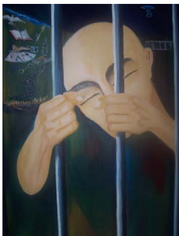
Pintura hecha en la cárcel de Villahermosa

La entidad no posee datos sobre la vinculación de entidades en años anteriores.